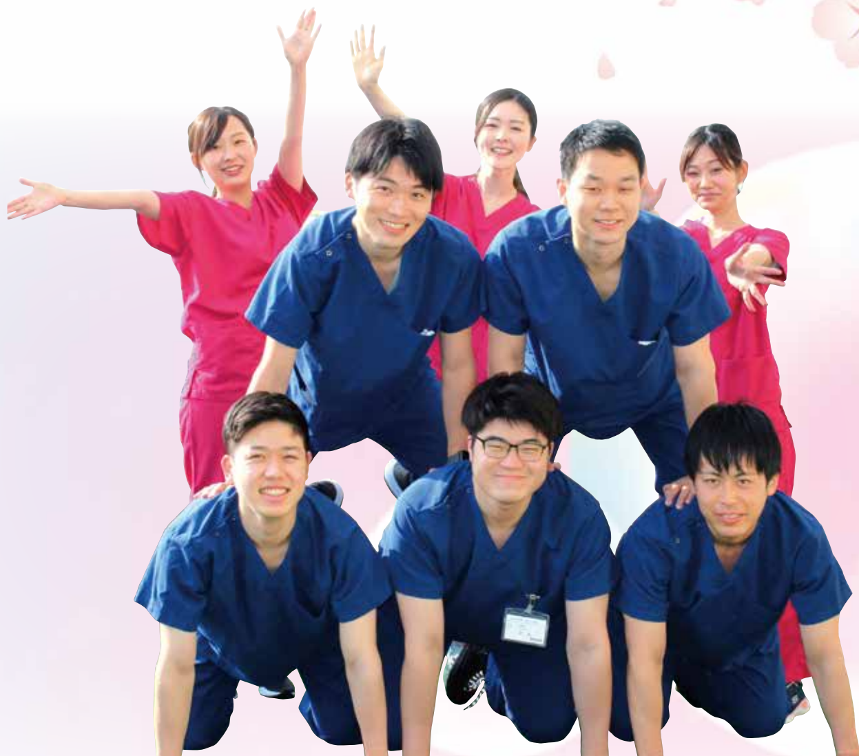
令和4年度の初期臨床研修医